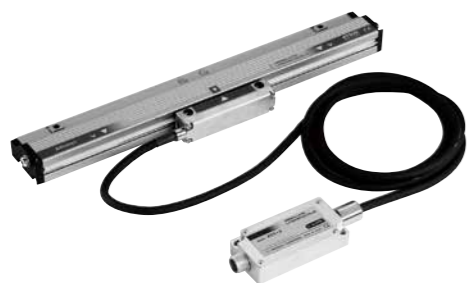
高剛性 SC タイプ