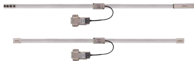
ABS ST1300 シリーズ (光学式)