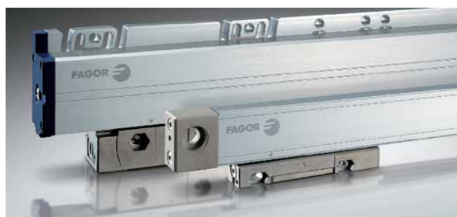
S3BP - G3BP シリーズ (MINAS A6)