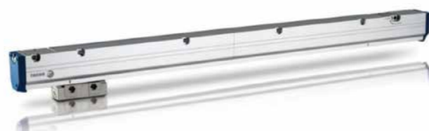
L3BP シリーズ (MINAS A6)