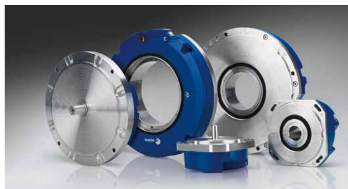
S2 - H2 シリーズ (MINAS A6)